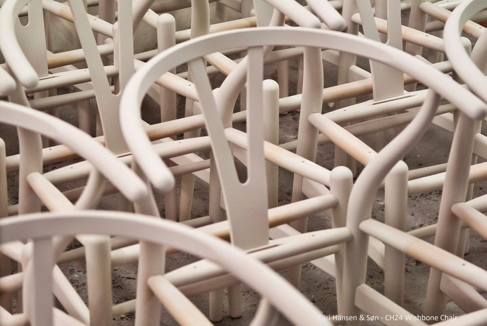
Carl Hansen & Søn - CH24 Wishbone Chair