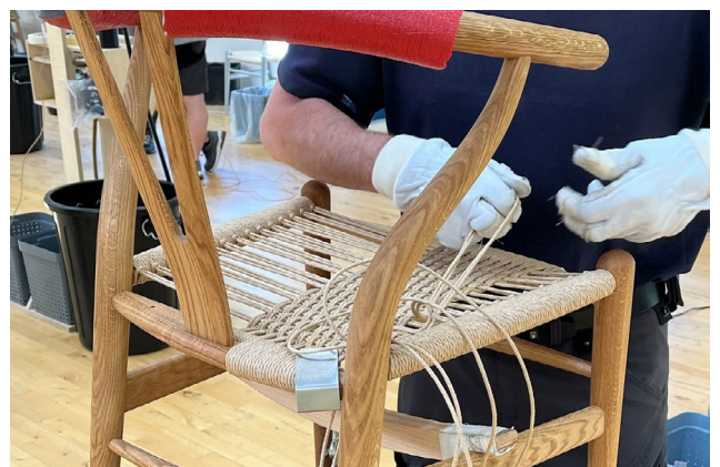
Werkstatt, Carl Hansen