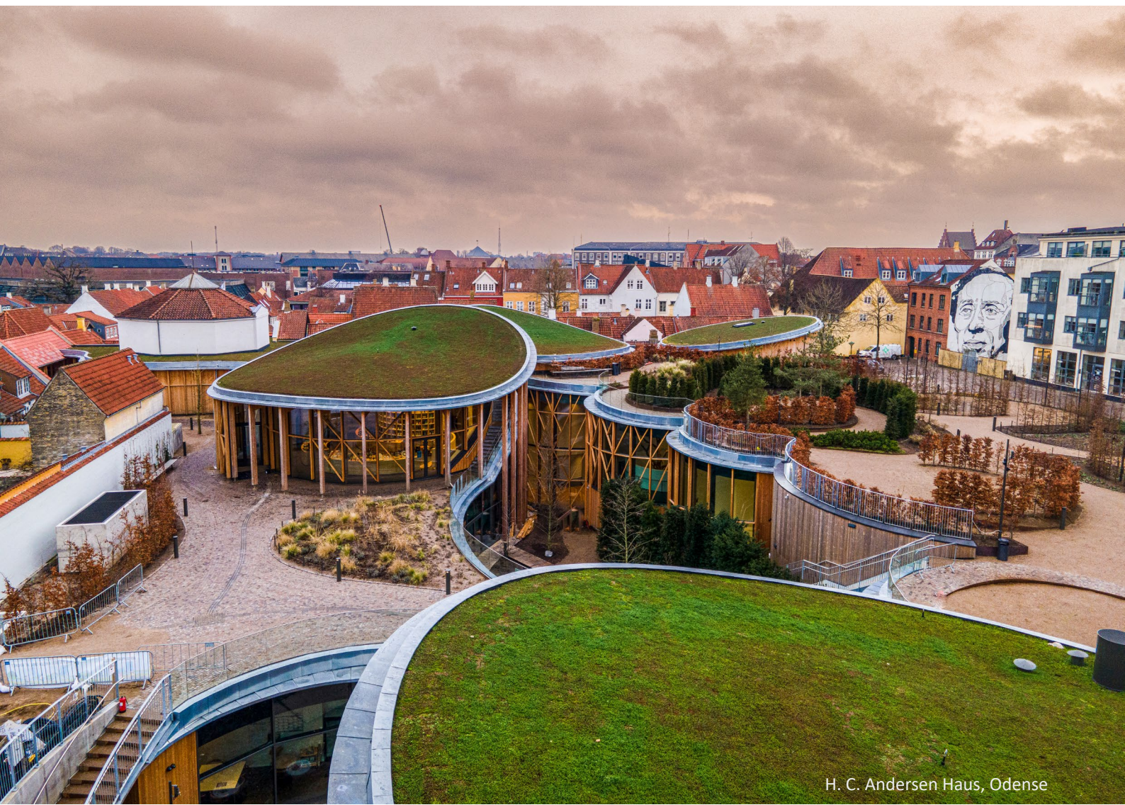
H. C. Andersen Haus, Odense