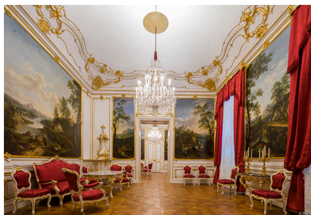
Zweites Kleines Rosa Zimmer

Die Anzahl der Plätze ist limitiert. Wir bitten um rechtzeitige Anmeldung.