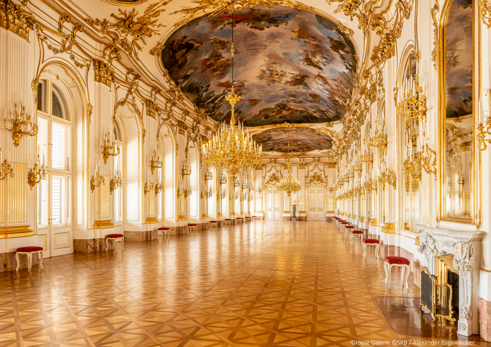
Grosse Galerie