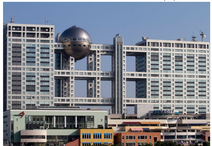
Fuji TV headquarters