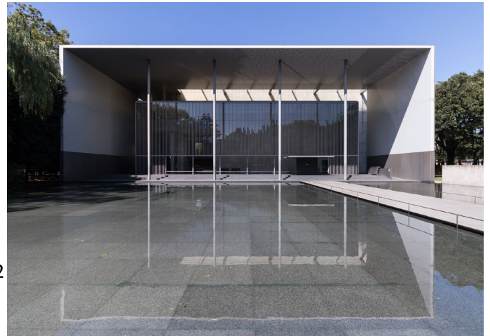
Gallery of Horyuji Treasures