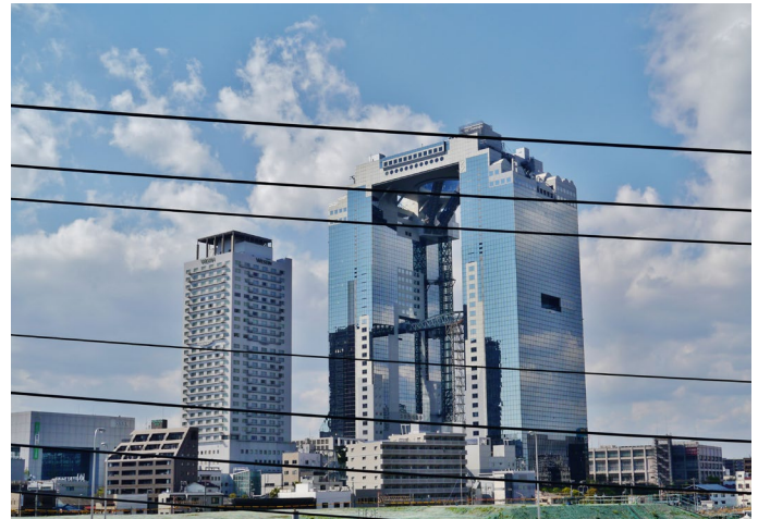
Umeda Sky Building