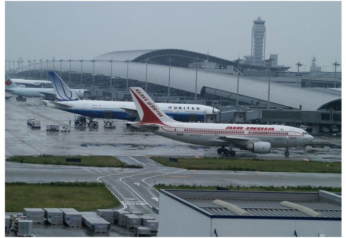
Flughafen Kansai, Renzo Piano, 1994

Programm Stand Juni 2024 (Änderungen vorbehalten)