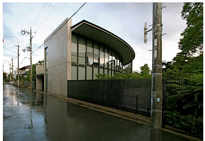
Shiba Ryotaro Memorial Museum