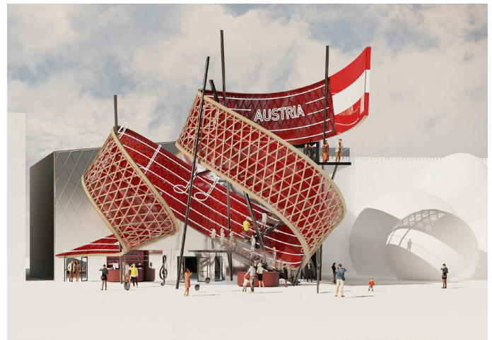
Österreich-Pavillon EXPO 2025 ©BWM Designers & Architects