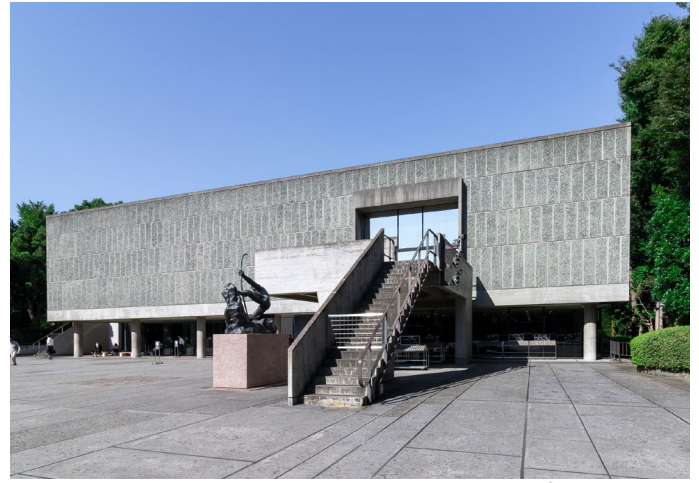
National Museum of Western Art