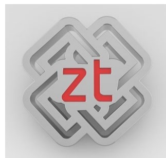
ZT – zertifizierte TrainerInnen Das Logo als Gütesiegel für die Qualität der Ausbildung.

Unsere Referierenden sind die besten ihres Fachs. Sie wurden im Rahmen internationaler Assessments ausgewählt und dürfen das Label „Zertifizierte/r TrainerIn“ führen. So sind Sie sicher, dass Sie nur die Besten unterrichten.